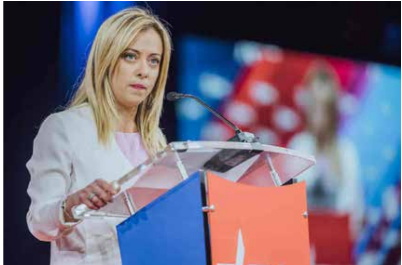
Georgia Meloni, del partido neofascista Fratelli d' Italia, preside el Consejo de Ministros de Italia desde octubre del 2022

Cuando llegué a Italia conocí a gente que se definía como fascista y que luego compartíamos muchos referentes musicales o culturales. Escuchaban a Fabrizio de André, leían a Pasolini y eran fascistas. Esto me derrumbó los esquemas y me hizo darme cuenta de mis propios prejuicios. Por eso me gusta recordar que es mentira aquello de que el fascismo se cura leyendo o viajando. Detrás de esta frase hay clasismo. ¿Para viajar y leer mucho qué necesitas? Dinero. No se puede achacar el fascismo a la ignorancia. Hay quien dice que parte de la clase trabajadora vota a los fascistas porque son ignorantes, y creen que una intelectualidad de izquierdas le iluminará y les llevará por el buen camino. No es así. Uno de los ideólogos de esta nueva extrema derecha es el francés Alain de Benoist. A finales de los años 60 se dio cuenta que los valores de la derecha eran percibidos como anticuados por parte de la juventud. Alain de Benoist inició esta reconversión o lavado de cara de la extrema derecha. Comenzó a leer a referentes de la izquierda como Antonio Gramsci y a trabajar en conceptos suyos como la hegemonía cultural. Alain de Benoist se dio cuenta de que no era tan importante llegar al gobierno