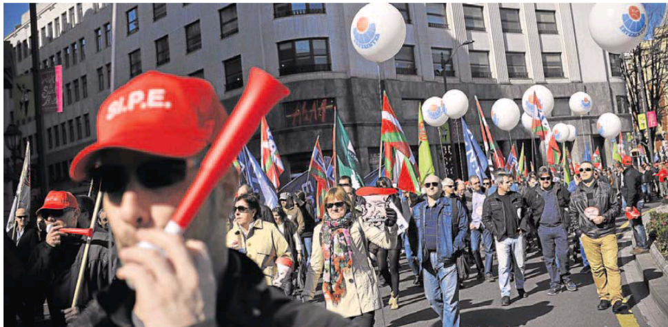
Una multitudinaria manifestación recorrió la Gran Vía de Bilbao.