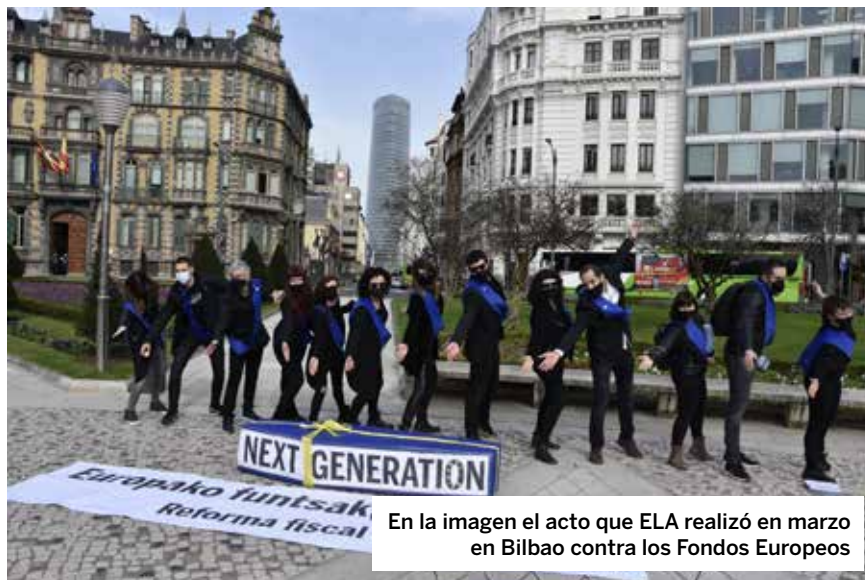
En la imagen el acto que ELA realizó en marzo en Bilbao contra los Fondos Europeos

A finales de año el Gobierno Vasco presentaba Euskadi Next , su segunda propuesta de planes para optar a los fondos europeos. Previamente se había filtrado otra propuesta, donde la mitad de los fondos se pretendían destinar al TAV y a proyectos de Petronor e Iberdrola. Euskadi Next es una propuesta más sofisticada, pero con el mismo fondo. Proyectos tractores de colaboración público-privada, muchos de ellos con una significativa falta de concreción. Y sin ningún tipo de consulta o intervención de otros agentes,