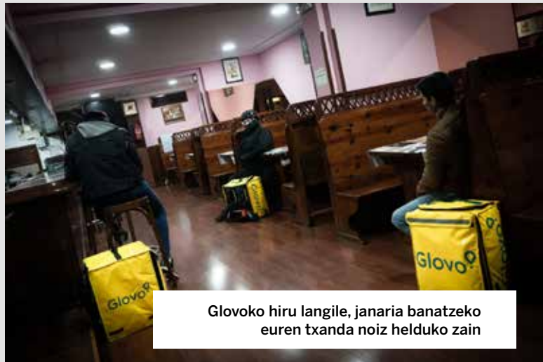
Glovoko hiru langile, janaria banatzeko euren txanda noiz helduko zain