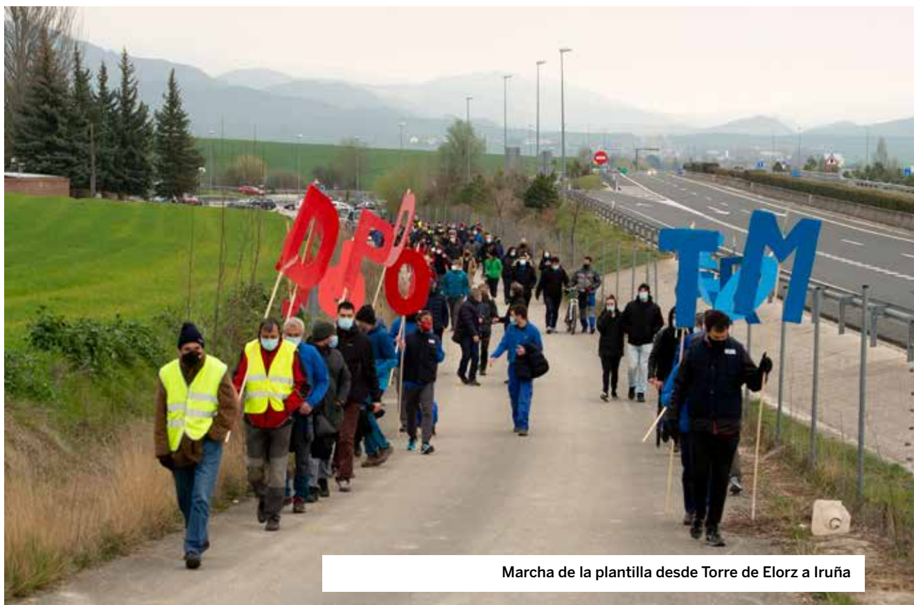
Marcha de la plantilla desde Torre de Elorz a Iruña

menos de una hora de antelación convocó mediante correo electrónico a la comisión negociadora, ya fuera de plazo. A pesar de que la representación de ELA no vio a tiempo la convocatoria, tanto la dirección de MTorres como los sindicatos CCOO y CITE decidieron realizar la reunión. A las ocho y media de la tarde, cuando uno de los delegados de nuestro sindicato ve el mensaje y se conecta, la dirección y los citados sindicatos habían aprobado ya la reapertura del periodo de consultas del ERE y la prórroga del mismo hasta el día 15 de marzo. Así mismo habían alcanzado un preacuerdo que fijaba el número de despidos en 63 con una indemnización de 33 días por año con un tope de 24 mensualidades, la propuesta que dos días antes CCOO ya había anunciado estar dispuesta a aceptar. Finalmente, planteaban llevar el preacuerdo a una votación telemática al día siguiente, a las 12:00, y en caso de ser ratificado, firmarlo inmediatamente después”.