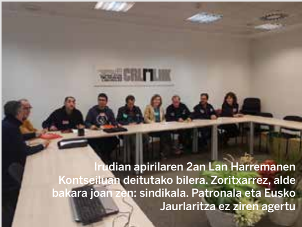
Irudian apirilaren 2an Lan Harremanen Kontseiluan deitutako bilera. Zorritzarrez, alde bakara joan zen: sindikala. Patronala eta Eusko Jaurlaritza ez ziren agertu

Goiko argazkiko mahaiaren hainbat lagun agertzen dira. Euskal Autonomia Erkidegoko Itunpeko Irakaskuntzan ordezkaritza duten sindikatueta kideak dira. Argazkia apirilaren 2koa da, eta Lan Harremanen Kontseiluak Bilbon duen egoitzan ateratakoa da. Hala ere, mahaiaren ez dago beste inor. Zergatik? Patronalek eta Eusko Jaurlaritzak uko egin ziotelako Gizarte Ekimeneko ikastetxetako gatazkari irtenbide duin bat emateko asmoz sindikatuak deitutako bilerara joateari.